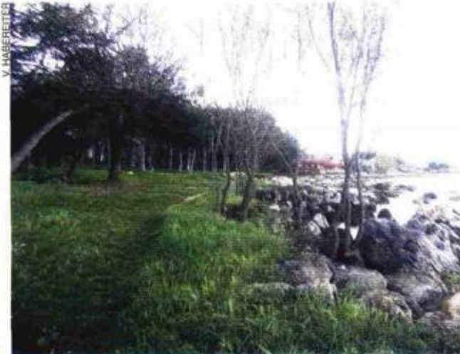
Staza do plaže popločit će se tlakovcem