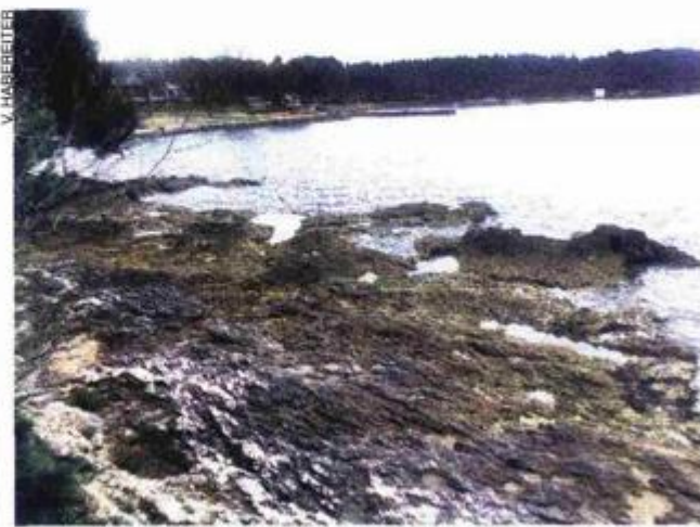
Dio uvale koji će se urediti gledano prema Brulu